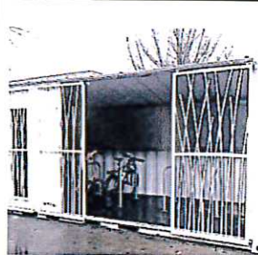
Le Bike Hut de Vif, a côté de la gare, a coûté 22 000 € terrassement compris.